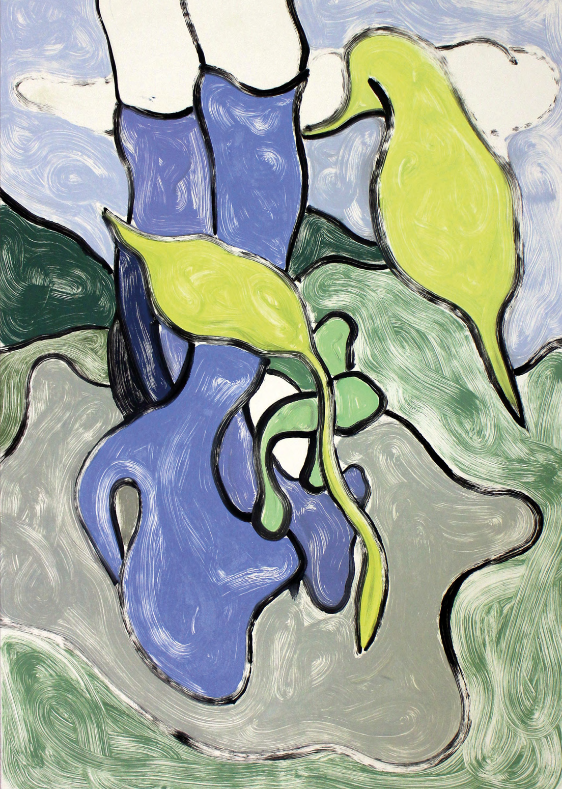
Morten Buch (f. 1970) Picnic , 2018 112 x 77 cm